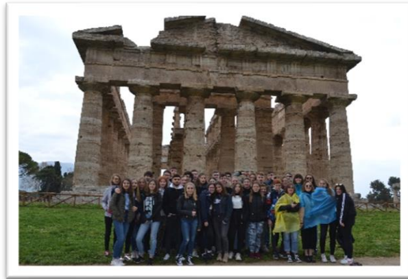
Les latinistes et hellénistes dans la région de Naples en 2019