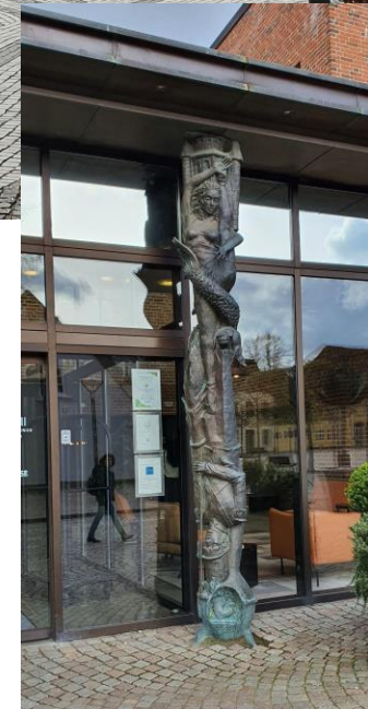
Odense et la magie des contes d'Andersen