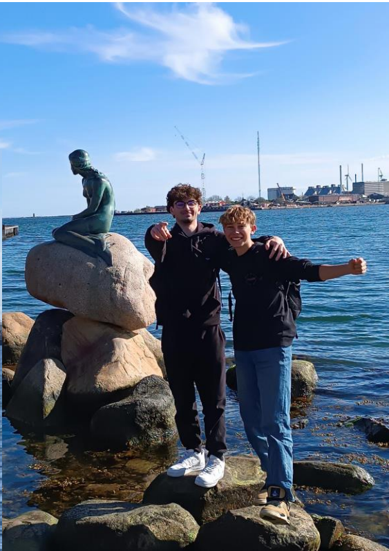
La petite sirène