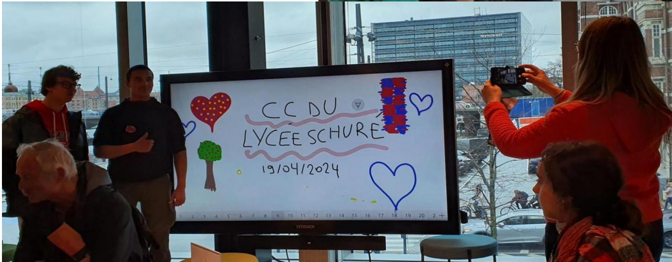
Au Danisch Architecture Center