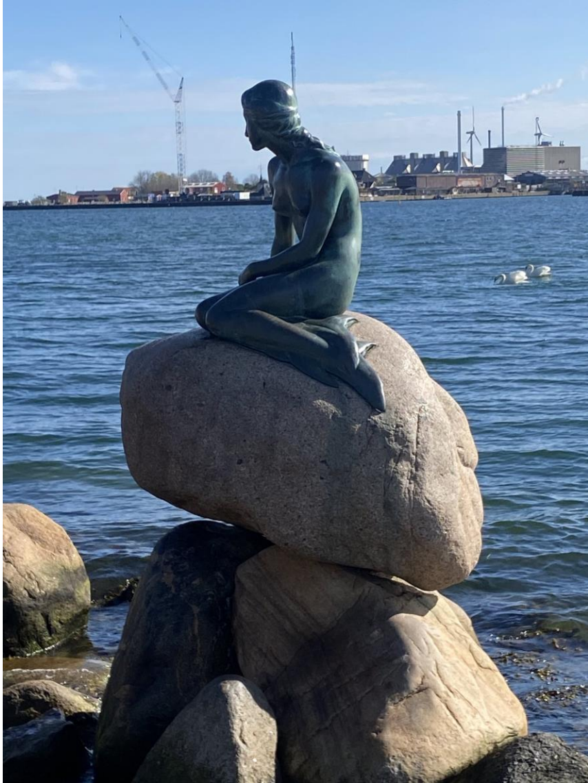
De lille havenfrue